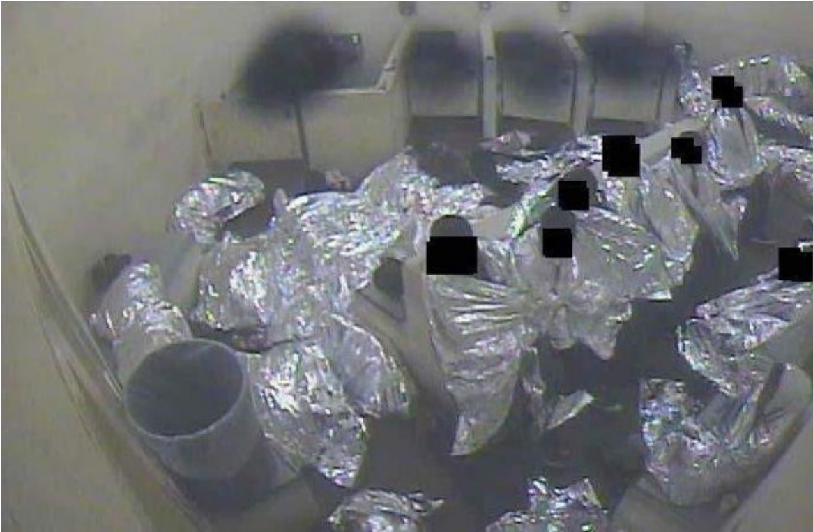
Instalación "Banderas", obra de Mauricio Esquivel