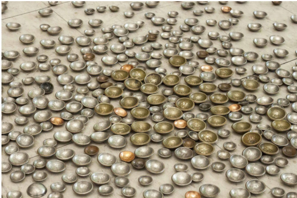
"Desde el Cielo", instalación de Mauricio Esquivel realizada con monedas de dólar