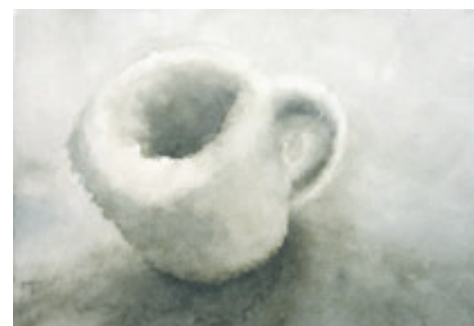
"Taza" pieza realizada en Acuarela del artista Ronald Morán, pertenece a la serie "Hogar, dulce hogar" (2013).